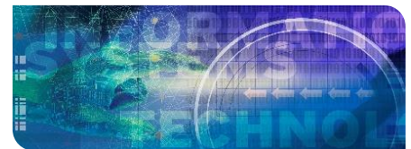
KIT-Zentrum Information · Systeme · Technologien

Die nahtlose Verbindung drahtloser Übertragungsstrecken mit Glasfasernetzen ermöglicht hochleistungsfähige Datennetze. (Ausführliche Beschreibung der Abbildung am Textende. Grafik: IPQ/KIT)