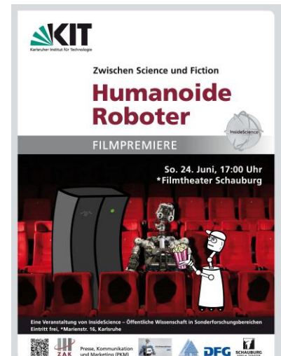
Roboter im Kinosaal: Plakat zur Film- premiere von InsideScience

Für InsideScience kooperieren das ZAK und PKM mit den KIT-Sonderforschungsbereichen 588 „Humanoide Roboter“ und TR9 „Computergestützte Theoretische Teilchenphysik“.