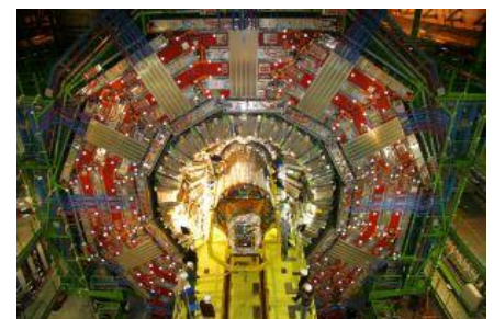
Bei KSETA sind Promovierende in interdisziplinären Großprojekten, wie beispielsweise am CERN, eingebunden.

Die Karlsruhe School of Elementary Particle and Astroparticle Physics: Science and Technology (KSETA) – Elementarteilchen- und Astroteilchenphysik: Wissenschaft und Technologie ist ein zentraler Baustein des KIT-Zentrums Elementarteilchen- und Astroteilchenphysik KCETA. Doktorandinnen und Doktoranden aus Physik und Ingenieurwissenschaften arbeiten hier gemeinsam an theoretischen Untersuchungen und an Großgeräten zu Fragen aus der Grundlagenforschung sowie an der Entwicklung moderner Technologien. Die Promovierenden sind in interdisziplinäre Projekte auf der ganzen Welt eingebunden, zu denen KCETA teilweise führende Beiträge liefert. Diese sind unter anderem das Pierre-Auger-Observatorium für kosmische Strahlung in Argentinien, der Teilchendetektor CMS am Large Hadron Collider LHC am CERN, das Karlsruher Neutrino-Experiment KATRIN, das Alpha Magnetic