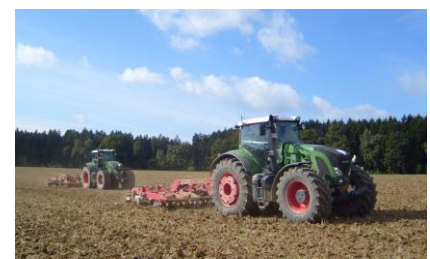
Ein Traktor übernimmt bemannt die Führung, der zweite Traktor folgt unbemannt und vollautomatisch – so funktioniert die elektronische Deichsel EDA.