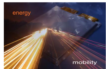
Energie und Mobilität: Leistungsstarke und kostengünstige Energiespeicher sind unerlässlich, um die Elektromobilität auf breiter Front zu verwirklichen. (Abbildung: KIT, Frau Maika Torge)

EDA – Elektronische Deichsel für landwirtschaftliche Arbeitsmaschinen. In der Landwirtschaft ist es seit Beginn des Ackerbaus üblich, große Nutzflächen mit mehreren Maschinen gleichzeitig zu bearbeiten, um die Produktivität zu steigern. Im Forschungsprojekt „Elektronische Deichsel für landwirtschaftliche Arbeitsmaschinen“ (EDA) wurde dieser Arbeitsverbund für Traktoren teilweise automatisiert: Von zwei mit GPS-Empfängern ausgestatteten Traktoren übernimmt ein Fahrzeug bemannt die Führungsrolle, während das zweite unbemannt und damit vollautomatisch folgt. Der Fahrer des Führungsfahrzeugs erhält die Möglichkeit, den Versatz des geführten Fahrzeugs in Längs- und Querrichtung zu definieren, den Be-