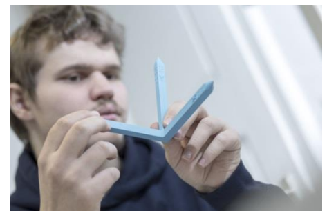
Im Drucklabor des Accessibility Lab lassen sich taktile Hilfsmittel für das Studium herstellen, z. B. ein 3D-Koordinatensystem für eine leichtere räumliche Vorstellung