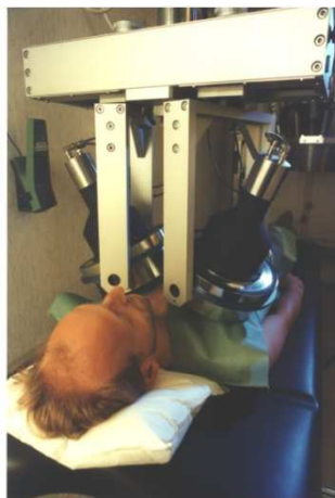
Messung im Teilkörperzähler (Lungenmessung)