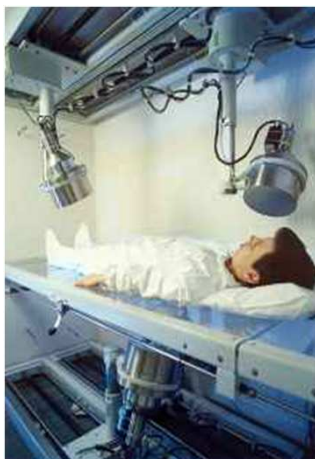
Messung im Ganzkörperzähler

Im Teilkörperzähler werden Messungen der Lunge, der Leber und Skelettmessungen (Schädel- bzw. Kniemessungen) durchgeführt.